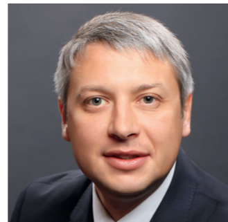
朱科斯基·列奥尼德