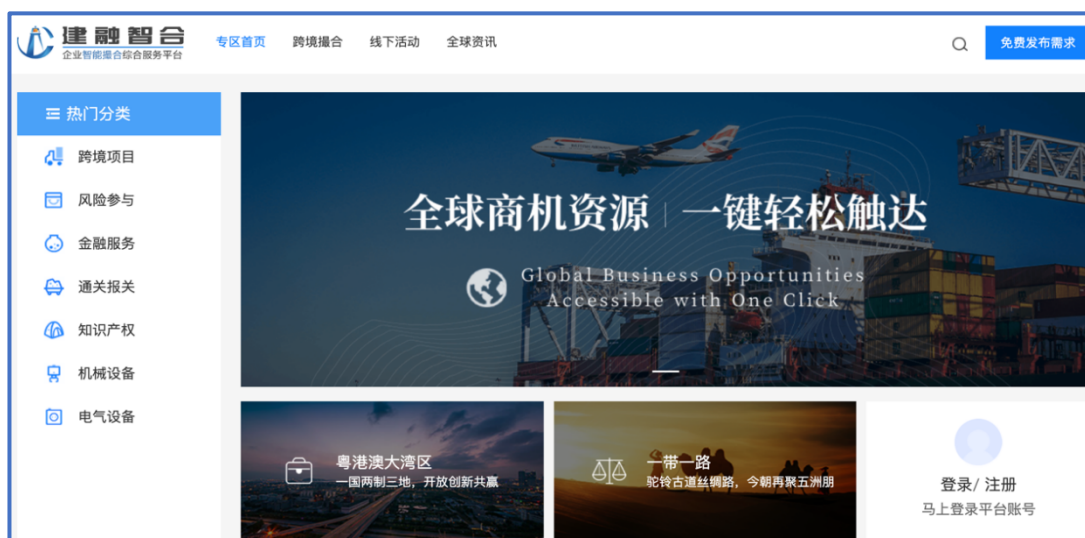
中文网站-跨境专区界面